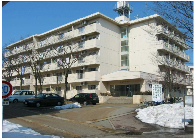
国際学生宿舎 国際学生宿舎