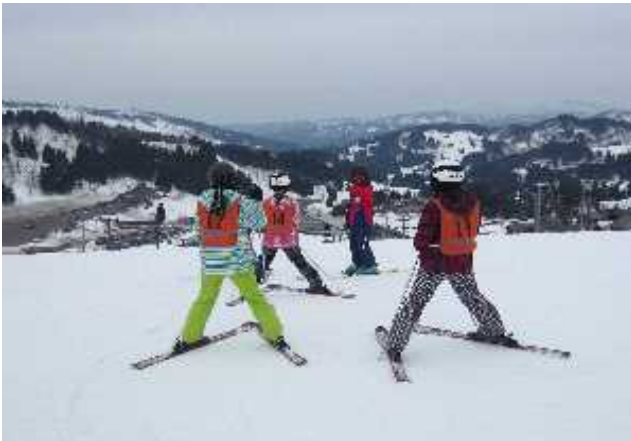
スキーツー 滑雪旅游