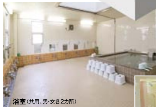
浴室 (共用、男・女各2カ所)