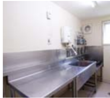
補食室 (共用、各階1カ所) コイン式ガスコンロ・瞬間湯沸器