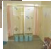
浴室内シャワー室 (男・女各2カ所)