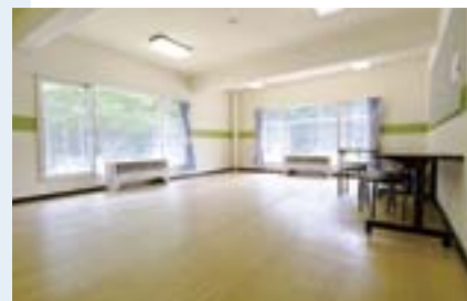
談話室 (共用、男2カ所・女4カ所)

防犯用に「カードロックシステム」を導入。 入館の際、学生証をカードリーダーに通して入ります。