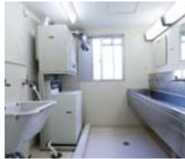
洗面・洗濯室 (共用、各階1カ所) コイン式洗濯機・乾燥機